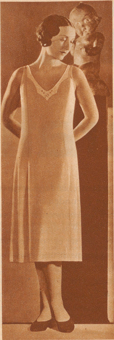
Hochgeschnittener Yala-Prinzessrock mit einfachem gestricktem Lorraine-Motiv.

Yala - hat diese Saison einen neuen Tricot herausgebracht: Matte Charmeuse, tatsächlich eines der schönsten und elegantesten Tricotgewebe, das es gibt. Wenn Sie Gelegenheit haben, lassen Sie sich die neuen Yala - Modelle aus diesem wundervollen Material einmal zeigen. Wie herrlich es sich schon anfühlt und wie weich und fließend es fällt. Eine wirkliche Freude, solche Wäschestücke zu tragen. Yala - Tricotwäsche finden Sie in jedem guten Geschäft, achten Sie aber auf die eingenahte Schutzmarke.