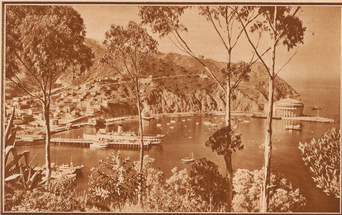
San Catalina Island, der beliebteste Badeort an der kalifornischen Küste