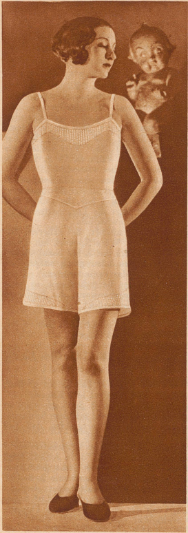
Yala-Garnitur bestehend aus Hemd und Hose. Verzierung mit tüll-ähnlichem Charmeuse-Stoff.