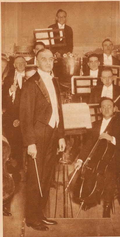
Rudolph Ganz als Dirigent des Symphonie-Orchesters in St. Louis, das unter seiner Leitung (1921 - 1927) zu einem der besten Orchester Nordamerikas sich entwickelte