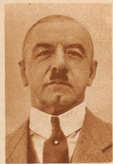
Der Musiker Rudolph Ganz, geboren 1877 in Zürich, heute Direktor des Musical College, Chicago

Durch die 1931 einsetzende schwere Krise, unter der das Musikleben in besonderem Maße zu leiden hat, wur-