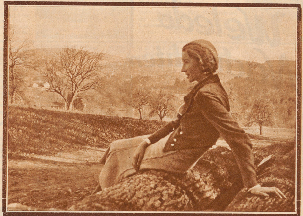
Rast am Waldesrand beim Isleren vor dem Abstieg ins Künsbacher Tobel