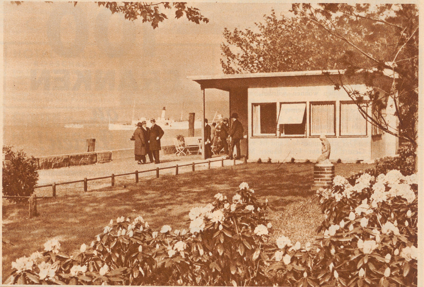
Aus der N. O. S.: Wochenendkolonie auf dem Kornhausquai. Hier wird mancher Leser seine kühnsten Träume verwirklicht sehen

Als Ergänzung zum Wanderatlas 2A werden wir, ebenso wie für Wanderatlas 1A ein «Heimatbuch» herausgeben, das über viele interessante Einzelheiten aus dem Wandergebiet «St. Gallen Nord» berichtet, z. B. über Geschichte, Volksleben, Volkswirtschaft usw. Bezügliche Hinweise im Wanderatlas sind mit HB bezeichnet. Endlich wird auch für dieses Gebiet ein «Grünes Auskunftsbuch», als Anhang zum Heimatbuch, erscheinen mit statistischen Angaben, Einzelbeschreibungen der wichtigsten Industrie- und Handelsbetriebe, Verpflegungs- und Unterkunftsstätten u. a. m.