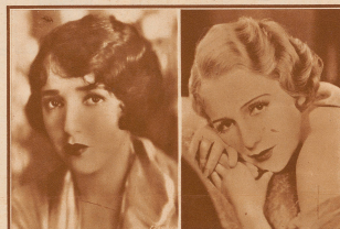
DIE AMERIKANERIN BÉBÉ DANIELS