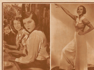
KATHE VON NAGY