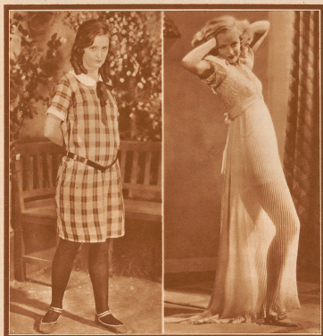
in ihrer Sommerkostüm: »Jugendtraum«