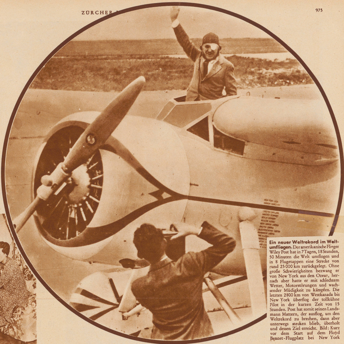
Ein neuer Weltrekord im Weltumfliegen. Der amerikanische Flieger Wiley Post hat in 7 Tagen, 18 Stunden, 50 Minuten die Welt umflogen und in 8 Flugetappen eine Strecke von rund 25 000 km zurückgelegt. Ohne große Schwierigkeiten bezwang er von New York aus den Ozean, hernach aber hatte er mit schlechtem Wetter, Motorstörungen und wachsender Müdigkeit zu kämpfen. Die letzten 2800 km von Westkanada bis New York überflog der tollkühne Pilot in der kurzen Zeit von 15 Stunden. Post hat somit seinen Landsmann Mattern, der ausflog, um den Weltrekord zu brechen, dann aber unterwegs stecken blieb, überholt und dessen Ziel erreicht. Bild: Kurz vor dem Start auf dem Floyd Bennet-Flugplatz bei New York