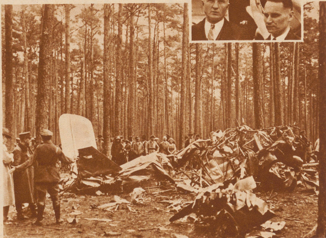
Die litauischen Ozeanflieger abgestürzt. In Soldin, in der preussischen Neumark sind die beiden litauischen Ozeanflieger Darius und Gironas mit dem Flugzeug «Lithuania» abgestürzt. Sie starteten 80 Minuten nach dem amerikanischen Rekordmann Post auf dem Floyd-Bennet Flugfeld in New York, überwand glücklich den Atlantik und stürzten zur Nachtzeit 600 Kilometer vor dem Ziele in einem Walde ab. Bild: Die Ueberreste der Maschine. Rechts oben Darius und Gironas vor dem Start in New York