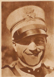
Mailand-Moskau ohne Zwischenlandung. Dem italienischen Flieger Bernardi gelang mit einem Caproni-Eindecker und vier Passagieren ein Nonstop-Flug von Mailand nach Moskau. Für die 2600 Kilometer lange Strecke benötigte er eine Flugzeit von 14 Stunden