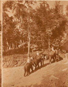
Die Elefanten auf dem Weg vom Arbeitsplatz zum Fluß