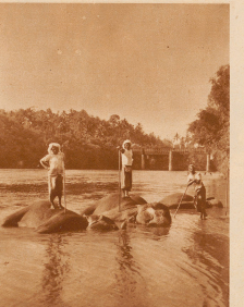
..... wo sie nach getauer Arbeit mit einem kühlen Bade sich erquicken