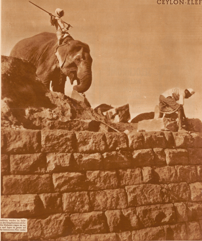
Die Steine werden im Steinbruch von den Eingeborenen abgebaut. Die Elefanten tragen sie zur Baustelle und legen sie genau auf den dafür bestimmten Platz nieder.

Der Elefant, den man in den Provinzen von Kandy zu sehen bekommt, ist gewöhnlich durch "Kraaken" gefangen worden. Derartige Fangzüge werden von den Häuptlingen von Zeit zu Zeit veranstaltet. Im Norden der Insel werden sie einzeln gefangen. Ein Dorfbewohner verfolgt eine Herde durch den Dschungel und schleicht sich soweit heran, daß er eines der Hinterbeine eines Elefanten mit einem Pfeil oder Hut stechen kann. Wenn nun das Tier sein Bein heben, befestigt der Verfolger schnell eine Schlinge an demselben, dessen andere Enden an einem starken Baum angebunden wird. Der Elefant erhebt dann so wenig Furcht, bis er zahm genug ist, um weggeführt zu werden, meist zum Verkauf an einen der Kandy-Häuptlinge, deren ausgebildete Elefanten seinen weiteren Unterricht bald beenden.