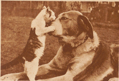
Wenn man sich «wie Hund und Katze verträgt», sieht es gewöhnlich nicht so aus