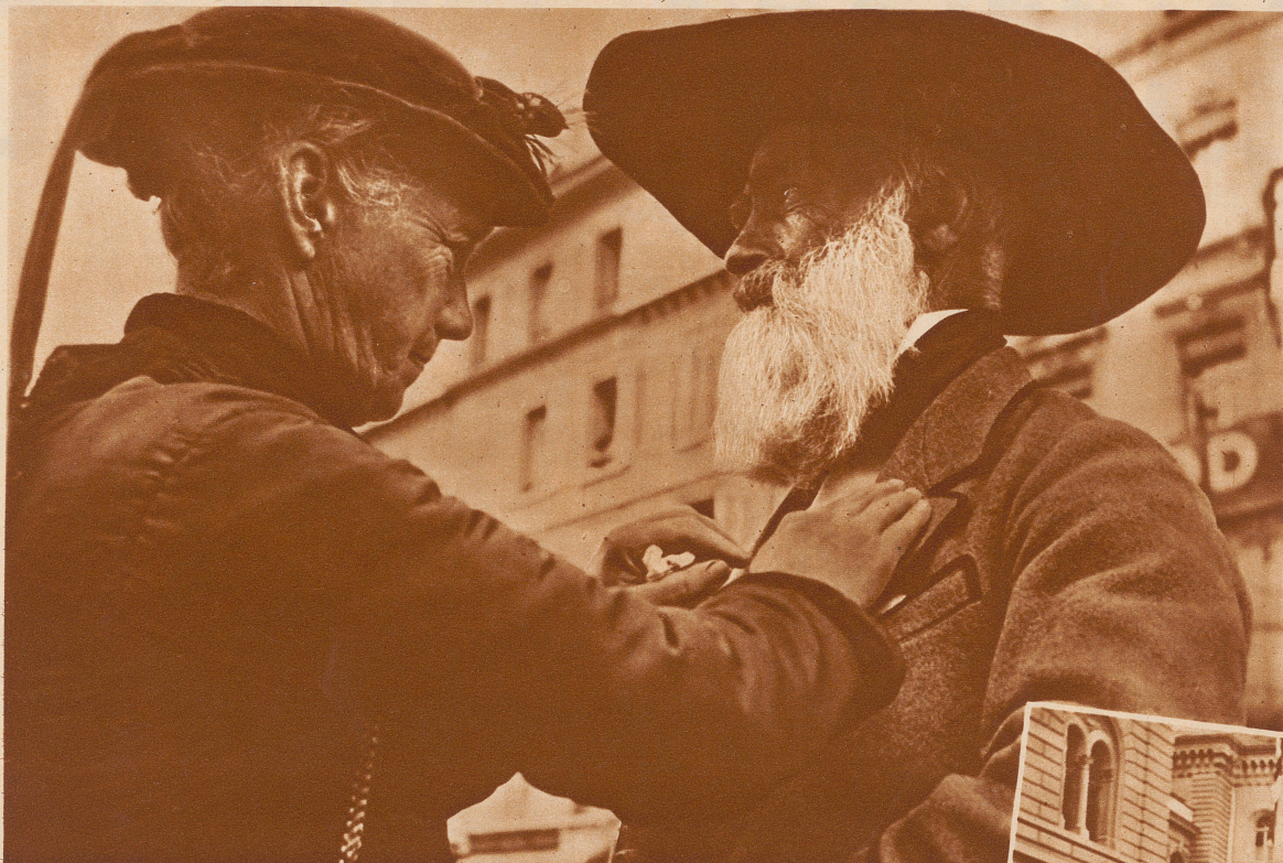
Aus allen Zipfeln des Bernerlandes kamen Schützen und Nichtschützen zur Jahrhundertfeier des Kantonalverbandes in der Bundeshauptstadt zusammen. Viele Festteilnehmer stellten sich in ihren Trachten ein. Bild: Das Guggisbergmüeti ordnet dem alternden Simishansjoggeli den Festtagskragen