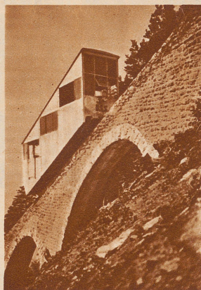
Neue Seilbahn in den Alpen. Am 19. August wurde die jüngste schweizerische Bergbahn von Schwyz auf den Stoos eingeweiht und dem Betrieb übergeben. Die Bahn weist eine Maximal-Steigung von 78 1/2 auf und ist somit die steilste Touristen- und Sportbahn der Schweiz. Sie überwindet in 12minütiger Fahrt eine Höhendifferenz von 750 Meter. Durch diese Linie ist ein schönes Sommerkurgebiet und ideales Skigelände der Zentralschweiz dem Verkehr erschlossen worden