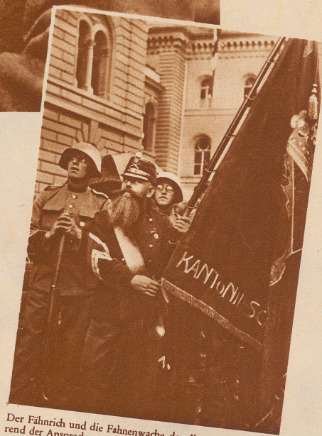
Der Fähnrich und die Fahnenwache der Kantonalflagge während der Ansprache von Bundesrat Minger