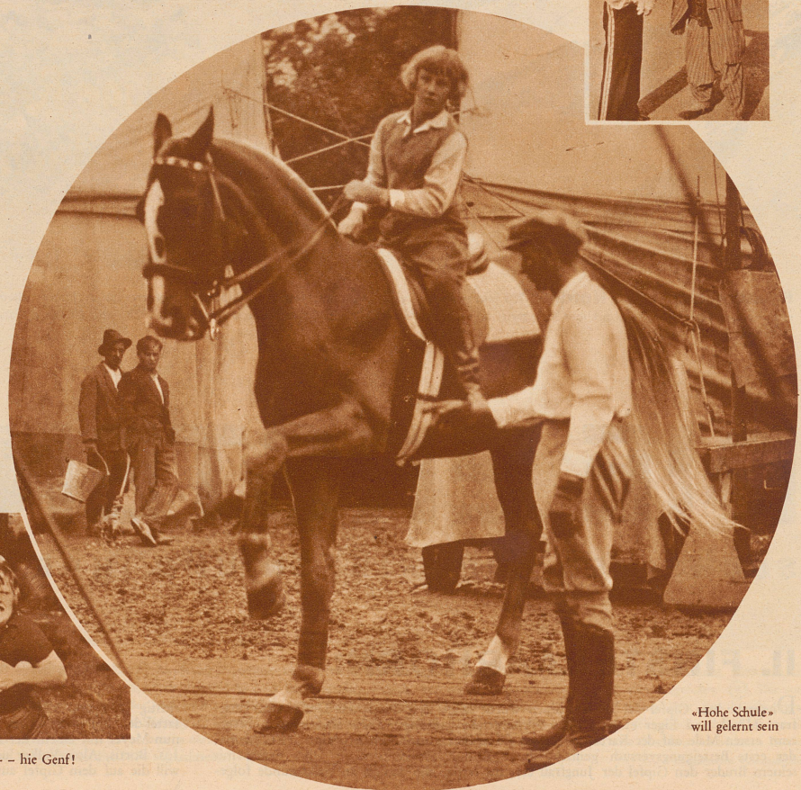
«Hohe Schule» will gelernt sein