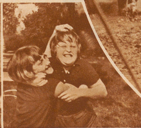
Hie Zürich - - hie Genf!