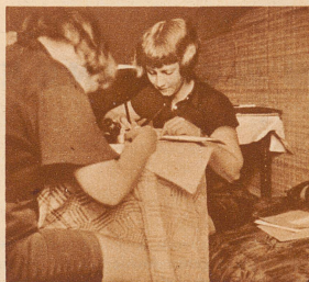
So halten wir Schule