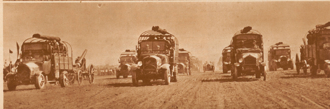
Die motorisierte schwere Artillerie