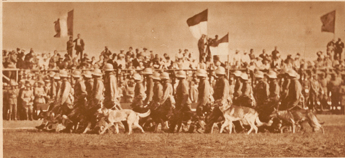
Das Detachement der Meldehunde, die Spezialität der zweiten Division