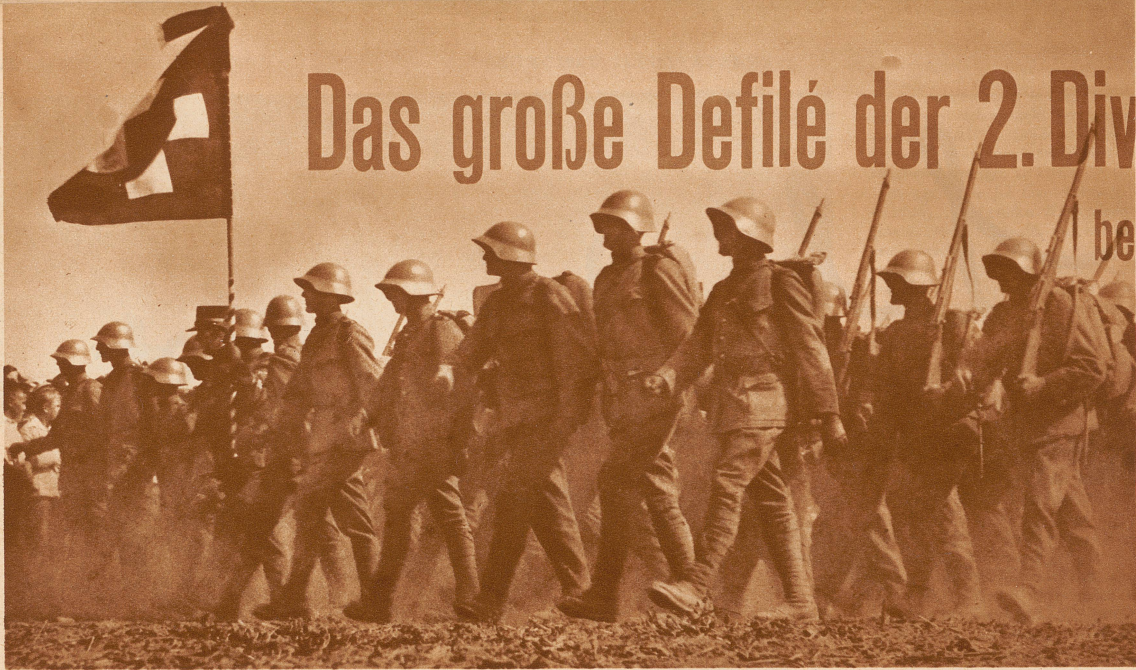
In Zwölferkolonnen defilierte in strammem Taktschritt die graue Masse der Fußtruppen. 15 Infanterie- und 3 Schützenbataillone