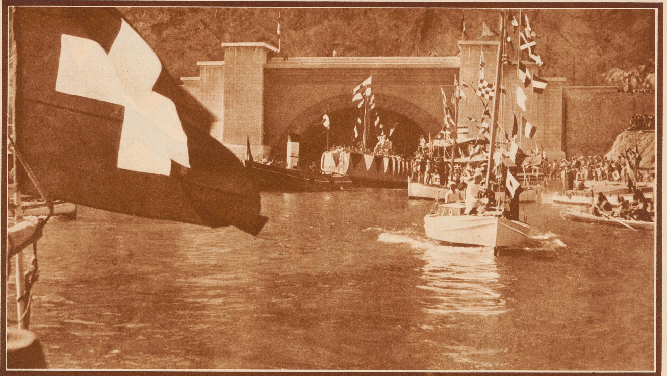
Rhonefest in Marseille. Vous êtes Suisse? Vous êtes Français??? Non Monsieur, je suis Rhodanien! Ich bin ein Rhone-Wesen. Ein Rhöner, ein Angehöriger also der großen Rhonefamilie derer, die längs der Rhone leben; dies ist auch eine Verbundenheit, eine andere als die der Nationalismen von heute. – Diese Verbundenheit ist der Sinn des großen Rhonefestes, das eben in Marseille unter starker Beteiligung auch aus dem Wallis, aus der Waadt und Genf gefeiert wurde. Bild: Ofrande au Rhône, Huldigung der Rhone am Rhone-Tunnel im Port Estagues in Marseille. Das Rhoneboot, auf dem auch die Schweizerfahne flattert, wird aus dem Tunnel des Rhonekanals gezogen