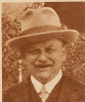
Leopold Ditisheim eine führende Persönlichkeit der westschweizerischen Uhrenindustrie, Begründer der großen Uhrenfabrik Movado in La Chaux-de-Fonds, starb 74 Jahre alt

Bundesrat Musy spricht für die Vorlage des Bundesrates. In der Gesamtabstimmung hat der Nationalrat das Finanzprogramm mit 107 gegen 49 Stimmen angenommen Aufnahme Bertschinger