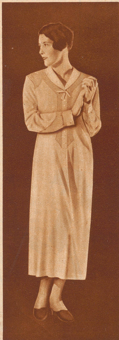
Elegantes Tricot-Nachthemd aus feiner Wolle plattiert mit Flor; angenehm mollig, auch für die empfindlichste Haut.