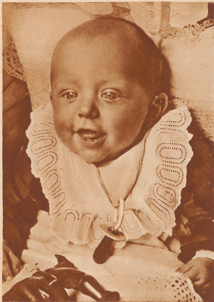
Hindenburgs 25 000stes Patenkind.

Gott sei Dank kommt uns jedes Jahr die Natur selbst zu Hilfe durch einen erbitterten Feind der Fliege: ein in