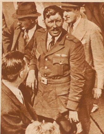
Kapitän Turner (Amerika) stellt einen neuen Rekord für den Nonstop-Flug über den amerikanischen Kontinent auf. Er legte die 4155 Kilometer lange Strecke Los Angeles-New York in 10 Stunden, 6 Minuten, 50 Sekunden zurück.