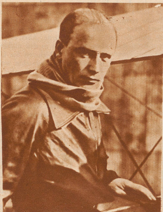
Gustave Lemoine (Frankreich) erreicht auf dem Flugplatz von Villacoublay mit einem 1000 PS starken Apparat die Höhe von 13 800 m. Er hat damit den bisherigen Welthöhenrekord für Motorflugzeuge um 400 m übertroffen.