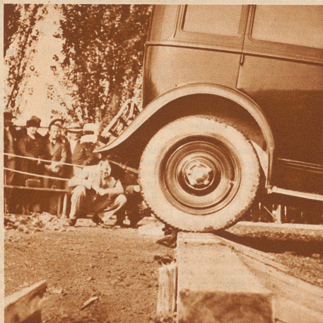
Rückwärts auf die Bodenschwelle. Mancher geriet auf den rückwärtigen Hang hinunter. Schadenfrohes Geschrei der sachverständigen Buben hinter den Seilen.