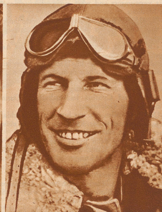
Kingford Smith (England) legt die Strecke London-Wyndham (Australien) in 7 Tagen 4 Stunden, 47 Minuten zurück. Der bisherige, von dem Engländer Scott gehaltene Rekord für den England-Australien-Flug wurde damit um 1 Tag, 17 Stunden, 32 Minuten unterboten.