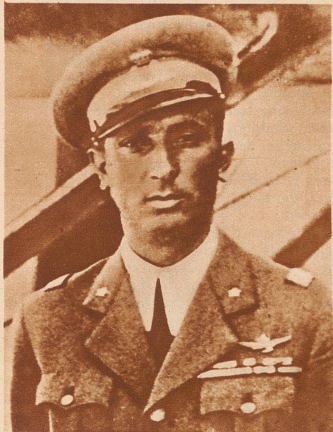
Oberst Cassinelli (Italien) erreicht mit einem Machi-Castaldi-Wasserflugzeug, versehen mit einem 2400-pferdigen Fiat-Motor, eine Geschwindigkeit von 629 Stundenkilometer. Der frühere Rekord, der von den Engländern gehalten wurde, betrug 552 Stundenkilometer.