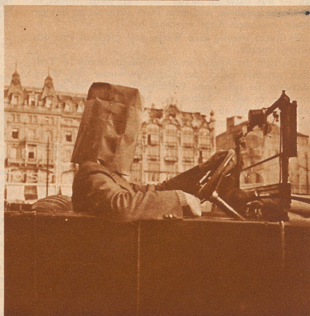
Stülpe dir einen Papiersack über den Kopf, und fahre gradaus. Wieviele gerieten da vom geraden Wege ab. Wer seinen Wagen vorher gut in die Richtung stellte, hatte allenfalls einige Aussichten, straffrei durchzukommen.