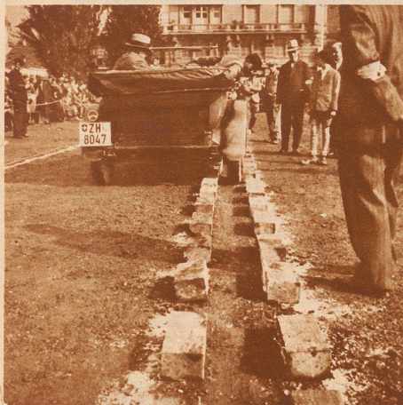
Rückwärtsfahren in gerader Spur. Klötze berühren gab Strafpunkte. Ein Herr im Fiat sauste durch, daß es eine Freude war. Beifall! Hie und da aber, wenn der Fahrer vorbei war, lagen die Klötze so unordentlich durcheinander, wie in einer Kinderspielstube.