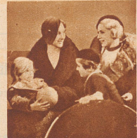
„Heutzutage braucht blondes Haar nicht dunkel zu werden. Endlich gibt es ein Mittel . . .“