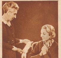
„So blond warst Du auch als Kind. Schade, Dein blondes Haar ist dunkel geworden.“