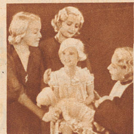
Alle Tanten bewundern Babys blonde Locken. Wie ein kleiner Engel schaut sie aus.