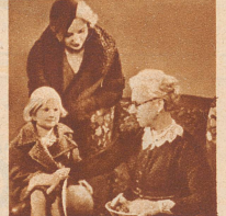
wodurch Bleichen überflüssig wird. Nurb blond erhält Babys goldige Locken.“

Kinderhaar, das von frühesten Jugend an mit Nurb blond, dem Spezial-Shampoo für Blondinen gepflegt wird, wird immer leicht und schimmernd bleiben. Denn Nurb blond nimmt auf die feine empfindliche Struktur naturblonden Haares besondere Rücksicht und verhindert das Nachdunkeln naturblonden Haares. Es gibt auch bereits nachgedunkeltem und farblos gewordenem Blondhaar den ursprünglichen Goldglanz zurück. Enthält keine Färbemittel, keine Henna und ist frei von Soda und allen schädlichen Bestandteilen. Überall erhältlich. Versuchen Sie es noch heute.