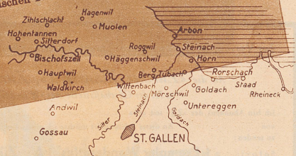
Fürstentum von Gossau bis Rorschach, Bischofszell-Arbon mit Anhang: Staad-Rheineck

Weiterweg zunächst geradeaus den Wald hinab, dann beim Bänklein in einer Kehre r. und weiter abwärts Richtung Kronbühl (HB) bis zur Landstr. unterhalb Armenhub (Autobus nach St. Gallen und Arbon; Halt beim altbekanntem Gasthof Krone, 3 Min.; Station BTB weitere 10 Min. beim Oedenhof.) Auf der Landstr. zunächst ein Stück weit stadtwärts bis zur Scherlerei Ziegler (l.); dort auf etwas rauhem Weg ins Tobel der Steinach hinab (HB 30) zum kleinen Elektrizitätswerk Obertobel, der Ziegelei Bruggwald A.-G. gehörend, der es jährlich 600.000 Kilowatt liefert. Jenseits des Steges in Kehren zur Unterführung der SBB-Linie hinauf und dann r. zum Hofe Schimishaus. Von hier gemäß Wegweiser Richtung Ob. Waid; HB 39) r. umbiegen gegen Guggelen, 680 m, mit großer Hühnerfarm, und weiter zur Kesselhaldenstr. vorbei am städtischen Friedhof Kesselhalde, 1922 eröffnet, und dem neuen israelitischen Friedhof, kenntlich am Davidstern