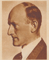
Minister Walter Stucki ist in Anerkennung seiner erfolgreichen Tätigkeit als Direktor der Handelsabteilung des Volkswirtschaftsdepartements zum Ehrendoktor der Universität Basel ernannt worden.