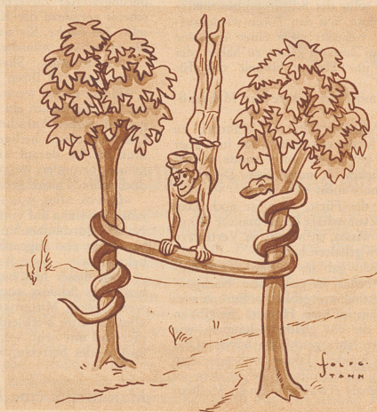
Der Schlangenbändiger macht Reckübungen.

Die Nachbarin kam zum Abendratsch. «Was ist mit dem Handtuch?» «Mein Mann hat heute seinen Bierabend. Kommt er vor eins, lege ich ihm das Handtuch auf die Stirn, kommt er nach eins, haue ich es ihm links und rechts um die Ohren.»