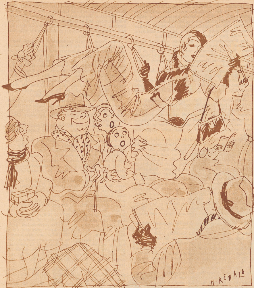
Die Gymnastik-Schülerin in der überfüllten Straßenbahn.