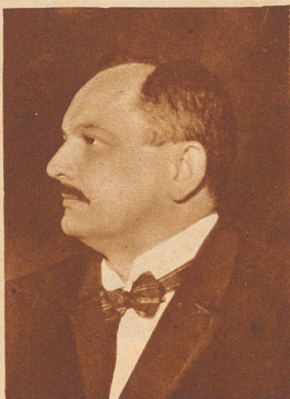
Ernest Béguin Staatsrat von Neuenburg Vizepräsident des Ständerates