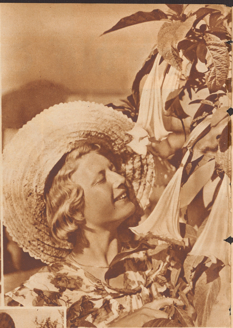
Blüten bei einem Landhaus auf den Kanarischen Inseln.