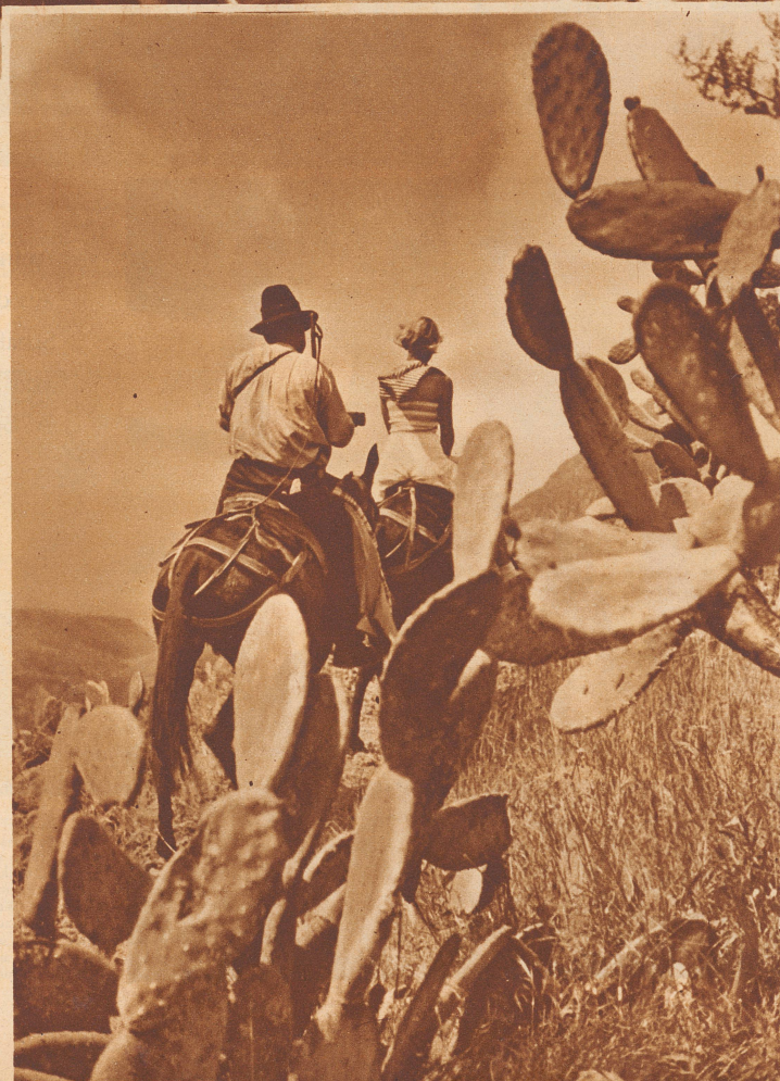
Auf dem Wege nach dem großen erloschenen Krater Caldera de Taburiente.