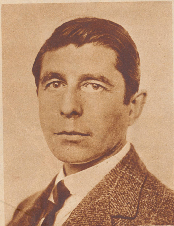
† Knud Rasmussen der bekannte dänische Polarforscher und Ethnologe, starb 54 Jahre alt in Kopenhagen.