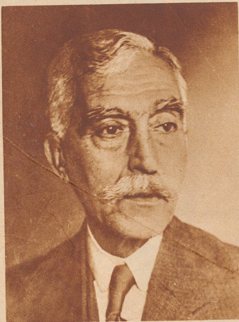
† Oberst Francisco Macia der Präsident der autonomen spanischen Provinz Katalonien, starb 74 Jahre alt.