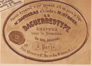
Die «Schutzmarke» der ersten von Daguerre gebauenen «camera obscura».