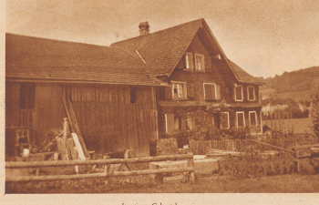
Isenring's Geburtshaus in Linsburg im Toggenburg.