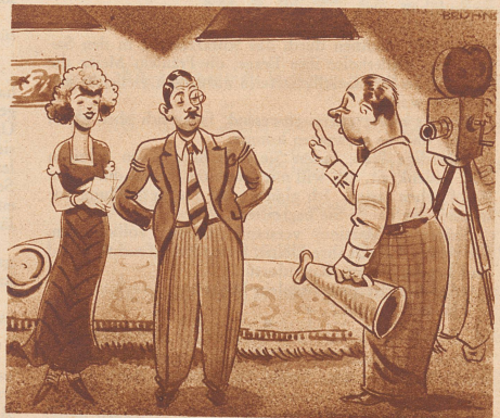
Regie. «Also in der nächsten Szene haben Sie eine lebhaftere Auseinandersetzung mit Ihrer Frau, - mit andern Worten - Sie haben gar nichts zu sagen!»

Rekord. «Um acht habe ich mich unter einer Laterne verlobt, um halb neun hat meine Braut die Verlobung wieder aufgehoben.» «Aha, die Laterne wurde inzwischen angesteckt!»