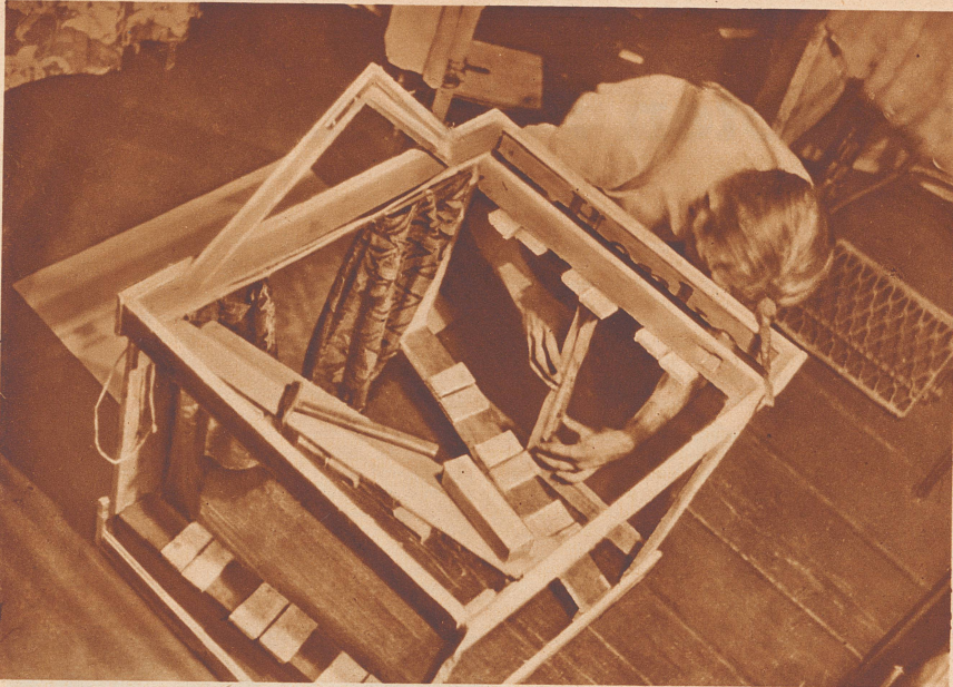
Die Wände der Kiste sind herausgenommen, der Vorhang ist schon bereit, nun werden die Soffitten und der Hintergrund eingesetzt.