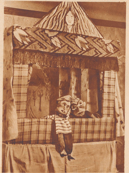
So sieht das fertige Kasperle-Theater aus.

Augen steckt ihr zwei Glasperlen ein, für den Hals befestigt ihr eine leere Fadenspule. Darüber wird dann später das Kleid gezogen und festgemacht. Die Brotköpfe läßt ihr etwa zwei Tage trocknen, bis sie schön hart und fest sind. Dann nehmt ihr eure Farben zur Hand und malt die Köpfe recht buntfarbig an. Eine geschickte Schwester, oder vielleicht sogar die Mutter selbst, näht gewiß aus alten Stoffresten die Kleider für die Figuren. Die Füße und Hände habt ihr auch aus Brot geformt und dann gefärbt, die werden einfach in die Kleider hineingesteckt und festgenäht. — Aber auf eines müßt ihr gut aufpassen: daß die Kleider hinten offen sind, denn dort muß der Kasperle-Direktor seine Hand hineinstrecken können. Ihr stellt euch doch nicht etwa vor, daß so ein Kasper ganz von allein redet und sich bewegt? Das ist ja die Hauptsache und das Lustigste dabei, daß ihr selber den Kasperle spielen könnt. Aber dabei kann ich euch jetzt nicht mehr helfen, das müßt ihr ganz allein ausprobieren, wie ihr die Hände bewegen müßt, damit der Kasper seine lustigen Sprünge recht echt und natürlich macht. Versucht es ein paarmal, dann wird's schon gehen. Nun muß allerdings der Kasperle-Direktor noch einen bequemen Platz haben, wo er sitzen oder stehen kann und man ihn doch nicht sieht. Vielleicht habt ihr einen Tisch, den