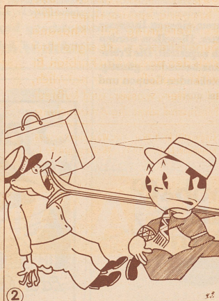
Die Bretter muß man tragen können Und nicht damit all' Leut anrennen!