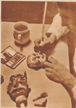
Die Puppenköpfe aus weichem Brot bemalt ihr in recht grellen Farben.