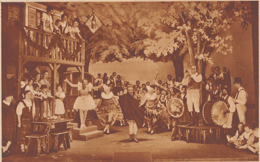
«Die verkaufte Braut»