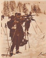
Die ganz Eiligen schonen mehend, ohne den Karabiner aus der Sturmpannkung abzuschalten.

Unter sehr reger Beteiligung fand am 14. Januar im Gebiet von Holzregg-bergern und Rickenbach der 2. Militär-Mann auf Feldstiele absolvieren. Für je-Verzicht leistete, und auf rasche Erledi- (Jillgau) mit einer Totalzeit von 1:43:15,4.