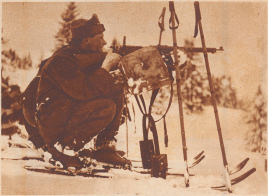
Diese Patrouille legt nur beschränkten Wert auf Treffsicherheit, indem sie mit der Noopankung am Karabiner in knauer Stellung abshot.