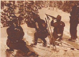
Die Patrouille eines Gebirgsjäger-Bataillons hatte die Karabiner daran auf die Sturmpannkung geschaltet, daß sie die Mänscheln einander loslösen konnten. Diese Patrouille jedoch also mit umgehängter Sturmpannkung, aber mit freiem Karabiner.