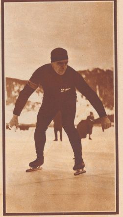
Der Finne Thunberg am Start zum 1500 m-Lauf, der ihn den Sieg brachte. Thunberg zu heute über 40 Jahre alt. Er durchläuft die unerbittlich klammernde 3 Meilen 23 Sekunden. Man beachte Haltung und Anblick, dem energiegelassen Mund, die gepressten, aber nicht steif bleibenden Körper und die Beweglichkeit der Arme - gilt es doch, auch nicht einen Bruchteil einer Sekunde zu verlieren.