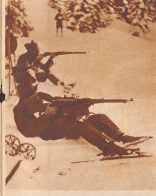
Die Mannschaft der Gotthard-Landsturm-Patrouille hat in der bei dem Gotthardrennen von alterer rühmlichen Intention oder auf dem Rücken liegende Stellung, wobei die Sturmpannkung zum Teil (auch als Schießunterlage verwendet wurde.