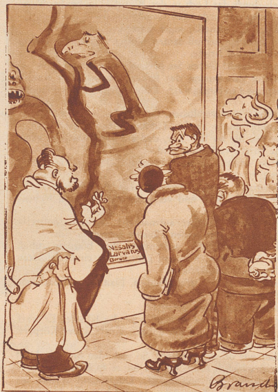
Besuch im naturhistorischen Museum

«Holen Sie tief Atem und sagen Sie dreimal 99!» befahl der Arzt bei der Untersuchung. «297», sagte der Kranke.