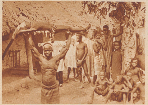
Nur in der Hypnose ist das Kunststück möglich, das dieser muskulöse, schwarze Jongleur hier mit dem Kinde zeigt.