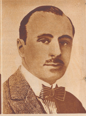
Hatry Bewürter der englischen Tradition