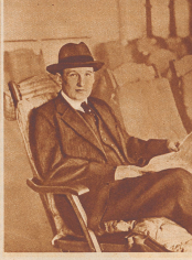
Lesage Verbreiter aus Varnhagenstr.