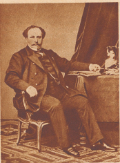
Strouberg der Napoleon der Industrie