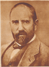
Stinnes das Genie ohne Privatleben