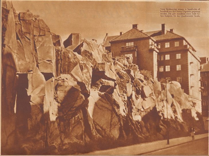
Neue Strahlenstränge münden in Stockholm oft haushoch aus dem harten Urgetein geprengt werden. Die 20-mal so hohe rechte hohen Enden für den Quadratterer Seeale.