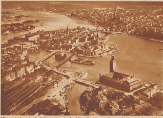
Fliegeraufnahme der Stadt Stockholm. In der Mitte die Altstadt. Der große quadratische Gebäudekomplex links mit dem Hof ist das königliche Schloss. Rechts im Vordergrund mit dem vierseitigen Turm liegt das berühmte Stockholmer Stadthaus. Vorherrscht die ruhende unter den neuen schicklichen Monumentalbauten Kampus. Das Stadthaus liegt am Mälaren. Das Wasser, das links aus dem Bild hinausfließt, ist der große Schiffsanleger. Ein paar Stunden lang führen da die Kreuzfahrter zwischen Klippen, Kafern und Vallen hinaus in die offene See.