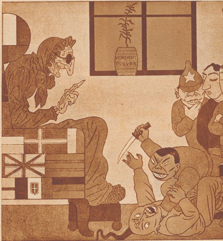
Völkerbund: «Pfui doch, Japsi, du solltest es der Tante doch wenigstens sagen, wenn du mal wieder ein bißchen Krieg spielen willst». «Simplizissimus», München

Die sogenannten humoristischen Zeitungen oder Karikaturen der westlichen Länder werden nicht müde, das Thema des japanischen Kriegsgeistes oder das Thema Japan-Völkerbund zu behandeln. Es sind ein paar Schlagworte, die immer wieder illustriert werden, ganz entsprechend eben den oft einseitigen und ärgerlichen Darstellungen japanischer Dinge in den Tagesblättern.