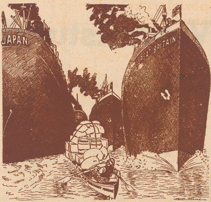
Die zusammengeschumpfte amerikanische Handelsmarine! «So möchten sie uns gerne haben». «New York American»