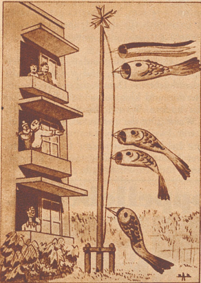
Vor einem westlichen, allermodernsten, japanfremden Steinbau flattern komischerweise nach altjapanischer Sitte die aufgeblasenen Fischhäute im Winde, welche anzeigen, daß im Hause ein Knabe geboren wurde.

Die Japaner haben ihrerseits ihre Karikaturen an die Adresse des Westens. Diese humoristischen Zeichnungen sind selber vom Westen beeinflusst und haben keinen rein japanischen Charakter. Sie erscheinen nur in den Tageszeitungen der Großstädte. Der eigentliche rein japanische Humor ist anders, leiser, auf der Freude am Wortspiel beruhend; es wird mehr verschwiegen und angedeutet, als ausgesprochen.