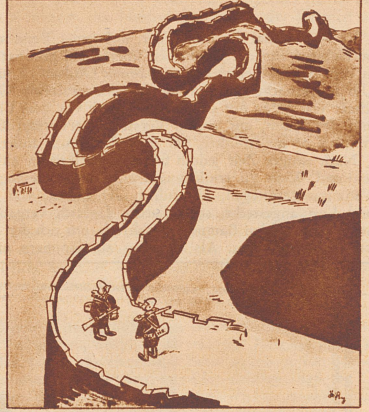
Zwei chinesische Soldaten begegnen sich auf einem Patrouillengang auf der großen, gewundenen Chinesischen Mauer. «Auf welcher Seite liegt nun eigentlich die Mandchurei?» fragt der eine den andern.