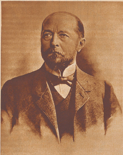
Der 80. Geburtstag eines großen Wissenschaftlers und Wohltäters der Menschheit.

Am 15. März jährt sich zum 80. mal der Geburtstag Emil von Behrings, des großen deutschen Forschers und medizinischen Nobelpreisträgers. Emil von Behring, einer der hervorragenden Vertreter der Bakteriologie und Immunitätsforschung, war der Entdecker des Diphtherie- und Starrkrampferums. Durch die Entdeckung Behrings ist die Sterblichkeit an Diphtherie von 76 auf 6-10%, gesunken.