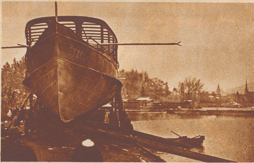
Das Schiff gleitet auf den zwei schiefen Balken, die mit Schmierseife eingefettet sind, seitwärts ins Wasser.

alles genau erklären: wie die Arbeiter und Techniker die dicken Balken unter das Schiff schoben und deren Gleitflächen mit Schmierseife einrieben. Wie sie den Schiffskörper vorsichtig gegen die Landseite zu neigten und auf der andern Seite des Rumpfes mit Keilen blockierten, damit das Schiff nicht mit dem Deck vornüber ins Wasser plumpste. Wie dann auf das Kommando: Los! zwei Männer mit einem Axthieb die dicken Seile, an denen das Schiff noch befestigt war, durchhieben. Wie das Schiff, eins, zwei, drei, die Balken hinunterrutschte und ins Wasser sauste, daß die Wellen hoch aufspritzten. Darauf fuhr eine Dampfschwalbe den «Etsel», so heißt das neue Schiff, über den See in die Werft. Dort kommt noch der Schiffsmotor hinein, Dach und Deck werden gebaut, bis die Schwalbe fix und fertig dasteht und im Monat Mai eingeweiht werden kann.