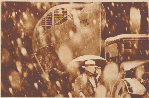
Bei heftigem Schneegestöber fährt «Etsel», das neue Schiff, zu nächstlicher Stunde durch die Straßen von Zürich.