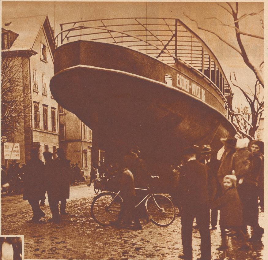
Das Schiff ist mitten in der Stadt stecken geblieben. Da es sonst in gefährliche Nähe der elektrischen Tramleitungen käme, muß der Transport auf die Nacht verschoben werden, wenn keine Tramwagen mehr fahren.