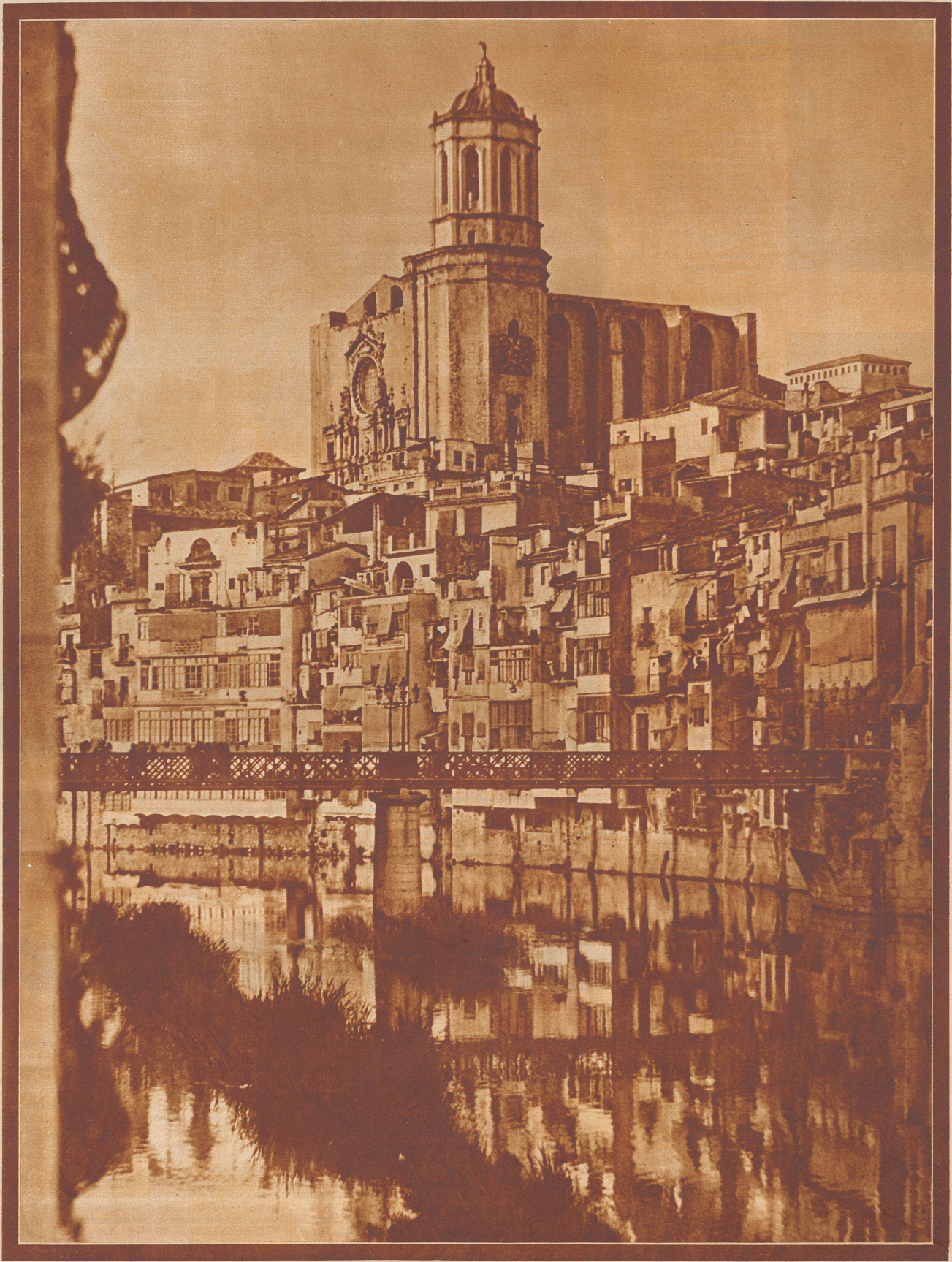
Die Stadt Gerona in Spanien