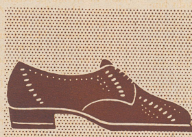
In Schönenwerd fabriziert Bally Schuhe von 15.80 — 24.80