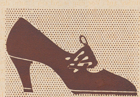
In Aarau u. Schöffland fabriziert Bally Schuhe von 21.80 u. höher