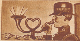
Der verliebte ...