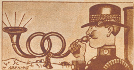
Der verheiratete Postillon