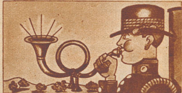
Der verlobte ...