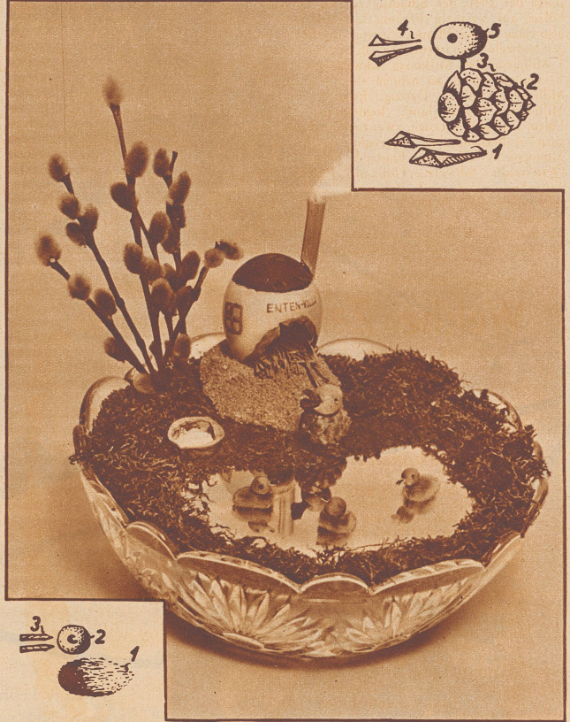
In der Ecke rechts oben wird gezeigt, wie man die Entenmutter macht. 1 sind die Schwimmfüße aus großen Tannzapfenschuppen. 2 ist der Rumpf aus einem Lärchenzapfen. 3 der Nagel, auf den man den Kopf steckt. 5 ist der Kopf aus einem Plastinklümpchen. 4 der Schnabel aus zwei kleinen Tannzapfenschuppen. In der Ecke links unten wird gezeigt, wie man die Entenküken macht. 1 ist der Rumpf aus einem Weidenkätzchen, 2 der Kopf, ein Plastinkügelchen, und 3 der Schnabel aus zwei kleinen goldgelben Holzstiften.

Nun kam das Schwierigste an die Reihe, die Entlein. Aber auch die wurden in einer Stunde auf die Welt gesetzt. Die Entenmutter bastelte Ruedi zusammen; ein Lärchenzapfen gab den Rumpf, einzelne Schuppen von Kiefernzapfen die Schwimmfüße und vorn in den Lärchenzapfen steckte er einen Nagel. Darauf kam der Kopf, ein Plastinklümpchen mit einem Schnabel aus zwei kleinen Zapfenschuppen. Die Entenküken waren einfacher, die machte Heidi. Es nahm einfach Weidenkätzchen, klebte ihnen ein Plastinkügelchen als Kopf daran und steckte zwei kleine gelbe Holzstifte als Schnabel hinein. Die Kinder setzten die lustigen Entchen auf den spiegelglatten Teich, und damit war der Frühling in der Kristallschale fertig. Die Mutter wird am Ostersonntag Augen machen, wenn sie sieht, was aus ihrer einfachen Kristallschale geworden ist. Wenn es noch nicht zu spät ist, liebe Kinder, so macht dieses Osterwerk doch auch. Zieht hinaus in Wald und Flur und holt euch dort das notwendige Bastelmaterial.