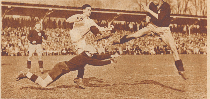
Das große Ostermontag-Fußballereignis. Grasshoppers besiegen Servette im Cupfinal 2:0 vor 20 000 Zuschauern im Berner Wankdorfstadion. Spannender Kampfmoment vor dem Grasshoppertor.

Die „Zürcher Illustrierte“ erscheint Freitags • Schweizer Abonnementspreise: Vierteljährlich Fr. 3.40, halbjährlich Fr. 6.40, jährlich Fr. 12.—. Bei der Post 30 Cts. mehr. Postcheck-Konto für Abonnements: Zürich VIII 3790 • Auslands-Abonnementspreise: Beim Versand als Drucksache: Vierteljährlich Fr. 4.50 bzw. Fr. 5.25, halbjährlich Fr. 8.65 bzw. Fr. 10.20, jährlich Fr. 16.70 bzw. Fr. 19.80. In den Ländern des Weltpostvereins bei Bestellung am Postschalter etwas billiger. Insertionspreise: Die einspaltige Millimeterzeile Fr. —.60, fürs Ausland Fr. —.75; bei Platzvorschrift Fr. —.75, fürs Ausland Fr. 1.—. Schluß der Inseraten-Aufnahme: 14 Tage vor Erscheinen. Postcheck-Konto für Inserate: Zürich VIII 15769 Redaktion: Arnold Kübler, Chef-Redaktor. Der Nachdruck von Bildern und Texten ist nur mit ausdrücklicher Genehmigung der Redaktion gestattet. Druck, Verlags-Expedition und Inseraten-Aufnahme: Conzett & Huber, Graphische Etablissements, Zürich, Morgartenstraße 29 • Telephon: 51.790