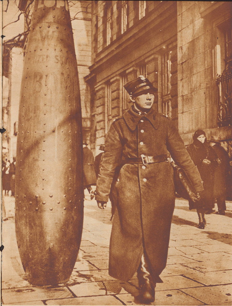
In Polen wird dem Luftschutzgedanken große Beachtung geschenkt. In den Straßen der Städte werben Plakate und riesige Fliegerbomben-Nachbildungen für Organisation und Ausbau eines wirksamen Luftschutzes.