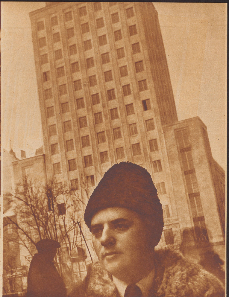
Warschau modernisiert sich. Durch eine Anzahl in neuester Zeit entstandener Hochhäuser hat sich das Gesicht der polnischen Hauptstadt vorteilhaft verändert.