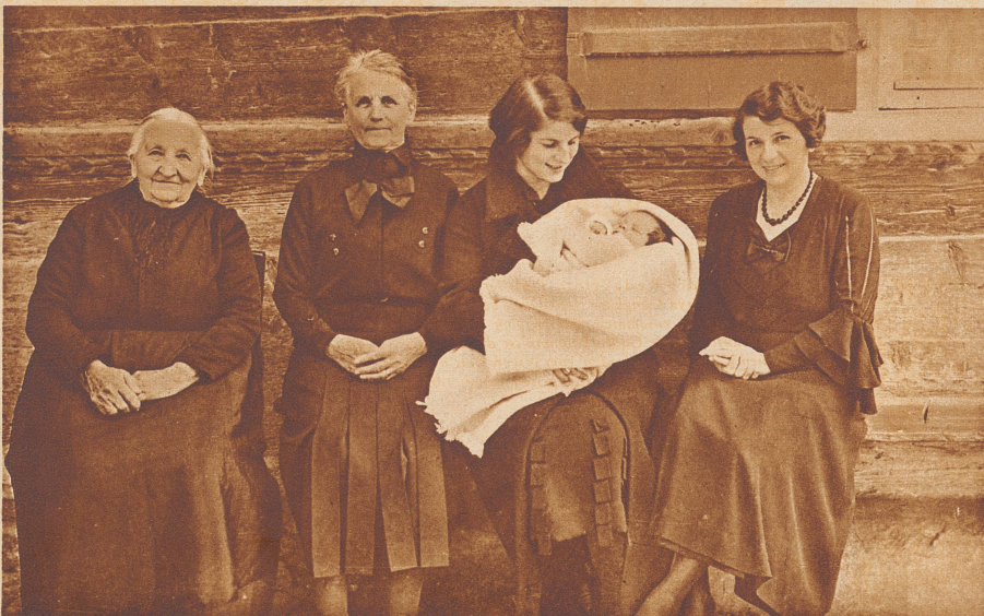
Ururgroßmutter, Urgroßmutter, Großmutter, Mutter und Kind. Die Ururgroßmutter feierte kürzlich ihren 86. Geburtstag, die Urgroßmutter ist 67 Jahre alt, die junge Großmutter steht im 42. Lebensjahr und ihre 21jährige Tochter hat vor 2 Monaten einem Mädchen das Leben geschenkt. Dieses außergewöhnliche Ereignis erklärt sich dadurch, daß sämtliche Mütter im durchschnittlichen Alter von 21 Jahren heirateten.