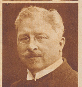
† Josef Räber Verleger des Luzerner «Vaterlands», Mitbegründer des Schweiz. Zeitungsverlegervereins und von 1915 bis 1929 dessen Präsident, starb 73jährig in Rom.