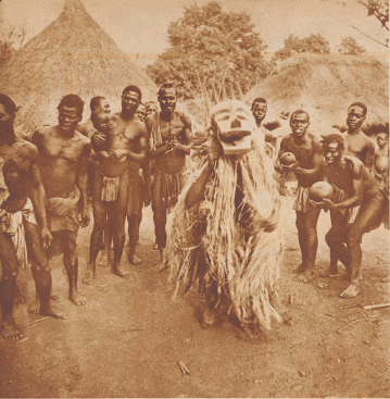
Festlichkeitszug auf dem Dorfplatz von N'Govia. Nur Männer sind auf dem Bild zu sehen; bei Totenräten ist es dem Frauen vorbehalten, einen Festzugs beizuwohnen.