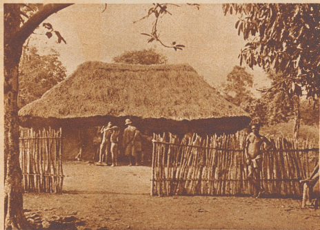
Das «beste Hotel» von N'Govia, wo wir während unseres Aufenthaltes über Neujahr abgestiegen waren.