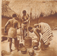
Bebo-Frauen beim Bananepflanzen. Selbst bei der Arbeit in der Pflanzung und im Haushalt werden oft die Kinder nicht abgeholt.

So wie dieser Neujahrsfest vergeht dem Neger auch das Jahr, sorglos wie dasjenige eines Kindes.