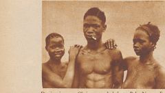
Das ist ein zum Christentum bekehrter Bebo-Neger. Er spricht gut französisch. Was er im Munde trägt, ist keine Zigarette, sondern ein Zweiglein, das zum Rauchen, als Zahnbürste verwendet wird. Die Frau mit der schwarzen Braut (rechts) ist seine eigene Gattin, das Mädchen links ist seine geliebte Amme, die bald seine zweite Frau sein wird, zur großen Freude der ersten, die davon von einem guten Teil der Arbeit im Haushalt befreit sein wird.