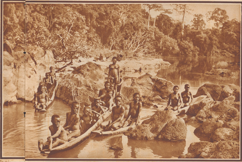
Während der Ausführung des Festzuges vergnügen sich die Frauen und die Mädchen im Strahlbad von N'Govia.

Bringt er es weiter, zu einer zweiten Frau, so freut sich die erste über die Entlastung. Da der Neujahrsfest diesmal nicht mit einem der drei Festtage, d. h. Feiertage der Woche zusammenfällt, beginnt er wie jeder andere Arbeitstag. Einige hübsche Mädchen stampfen den Reis abwie beim ersten Tagesrauen. Die Hühner gackern von den Höhen herab. Dann beginnen die besten Weidewerter ihr Gewässer. Zu Hunderten haben sie ihre gelochten Netze in den Büschen im Dorf aufgehängt. Täglich kann man ihnen zuschauen, wie sie die Grabsalme zu krummten Knoten verknoten. Aufgedreht von einem fächerförmigen Gebilde, stützt sie aus dem Feld. Vor der nächsten Hütte sinkt eine alte Frau, von Buben gestützt, wie ohnmächtig zusammen, während zwei Männer daneben kauernd weiter heulen. Sogar das Bocklein mit seinem Kitz ist dahergekommen. Aber die übrigen Leute des Dorfes scheinen wenig Anteil zu nehmen. Denn es ist die übliche Gehalt um einen verstorbenen Verwandten, das alle zwei bis drei Tage in der Frühlings wiederholt wird. Da kommt die hübsche Amme, ein noch unberührtes Mädchen, und setzt sich vertraulich auf mein Fohlen, aber plaudern kann sich nicht mit ihr.