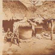
Zu jeder Neujahr der Bebo geben sich bis zwei zylinderförmige Lehmstücke, in denen die Nahrungsmittel (Jamswurzel, Reis und Mais) aufbewahrt werden.