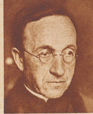
Domdekan C. Caminada ist zum Generalvikar des Bistums Chur ernannt worden.