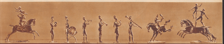
Welche die einzelnen Phasen eines Zinnsoldatenprogramms darstellen.