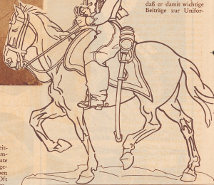
Die gezeichnete Vorlage für ein Zinnfigurenmodell. Eine Kavallerie-Ordnung der schweizerischen Armee aus dem Jahre 1862. Genau uniform- kundliche und historische Studien gehen dem Gieß-einer solchen Figur voraus.

men- und Trachtenkunde liefert, versteht sich von selbst. Begehrteste Sammler lassen für ihre Figuren historisch und landschaftlich echte Kollagen herstellen. Alte Städte, Denkmäler und Landschaften erleben auf diese Art einen Wiederaufbau im Kleinen. Diese Darstellungen nennt man Dioramen. Neuerdings ist vom Schweizerischen Heimatwerk die Idee verwirklicht worden, Zinnfiguren, die Typen aus dem schweizerischen Volksleben darstellen, von erbetenen Heimzweckern bemalen zu lassen. Die Leute, einmütige Sticker und Hegebauer, haben schon nach einer kurzen Lehrzeit eine ganz verblüffende Fertigkeit an den Tag gelegt. Ganze Dörfer, Märkte und Volksfeste entstehen in bausar Reihenfolge unter den geschickten Händen. Die Zinnschmelzen werden dem den Spielzeughändlern zugeführt, wo sie in hübschen Spinnradstühlen zum Verkauf kommen. So macht es nicht allein Sammlern vorbehalten, diese wertvollen Klein-kunstwerke zu besitzen, sondern die Zinnfiguren erfüllen wieder ihre ursprüngliche Bestimmung, sie sind ein farbreiches, phantasieerregendes Spielzeug, und gleichzeitig bringt ihre Herstellung einer beachtlichen Anzahl von Familien eine kleine Verdienstmöglichkeit. H. W.