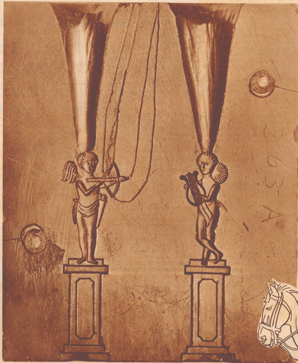
Die vordere Seite einer Gießform für Zinnfiguren. Durch die beiden stützenförmigen Kanäle wird die flüssige Zinn in die Form gegossen. Die beiden schürfförmigen Kanäle zwischen den Figuren dienen der beim Eingießen des heißen Zinnes erforderlichen Luft als Ausgang.

Wer kennt nicht das Märchen vom standhaften Zinnsoldaten, der in herrlicher Farbeberei- tung voll zwischen Gleichmut und Tod in den Fluten fahret. Und wenn heute von Kathedern und Kanzeln verkündet wird, Spiel mit Zinnsoldaten sei Spiel mit Kriegsgedanken, dann darf man hervorheben, daß Männer, Künstler und verdiente Historiker, deren der Gedanke an kriegerische Spiele fern liegt, sich