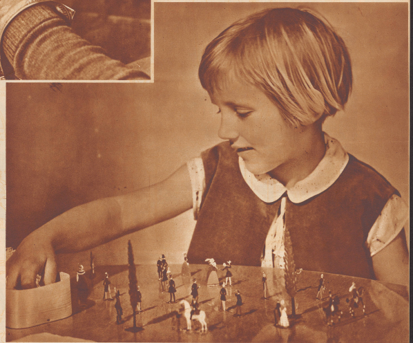
Aber die Zinnfiguren stehen nicht nur wie Museumstücke in Glaskäsen und Vitrinen. Als bunte, entzückende Spielzeuge haben sie neuerdings in den Kinderstuben Einzug gehalten.

The Underlying in diesem Artikel wurde eine freundliche zur Verfügung gestellt von Herrn Ernst Huber, membre honoraire de la Société des collectionneurs de soldats d'étain à Paris