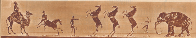
Zinnfiguren von wunderbarer Feinheit und Präzision.