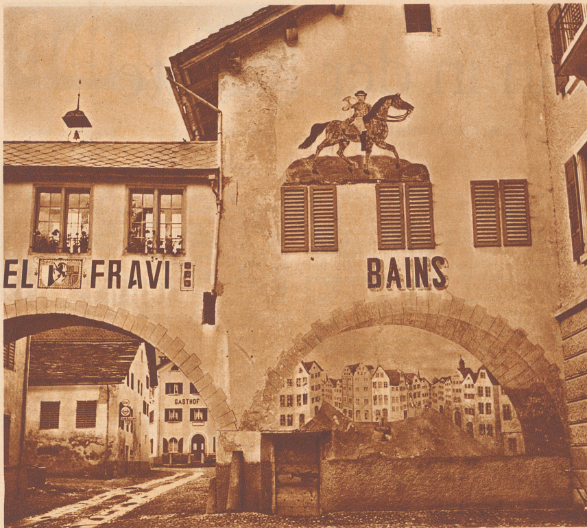
Andeer. Die nämlichen erdigen Wasser wie sie in Yverdon, Leuk und Weissenburg vorkommen, besitzt auch Andeer, dieses alte, an Sehenswürdigkeiten reiche Bündnerdorf. Andeer liegt zwischen Thuisis und Splügen, und die bereits erwähnten Plagegeister – Blut-, Herz- und Nervenleiden – werden hier gepflegt und oft mit gutem Erfolge geheilt.

auch die Annahme. Bébé tanzte hervorragend, und er verdankt vor allem dieser Kunst seine Unsterblichkeit. Er erlangte sie auf dem Umweg, daß er eines Tages als Tänzer in eine Pastete eingebakken wurde.