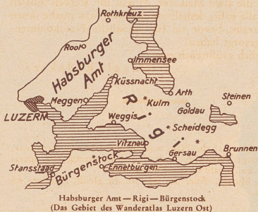
Habsburger Amt — Rigi — Bürgenstock (Das Gebiet des Wanderatlas Luzern Ost)

Jeder Leser findet hier den für ihn passenden Bezugszettel. — Auch die vorher erschienenen Wanderatlanten 1A: «Zürich Süd-West», 2A: «St. Gallen Nord» und 4A: «Basel Süd-West» sind noch zu gleichen Bedingungen lieferbar.