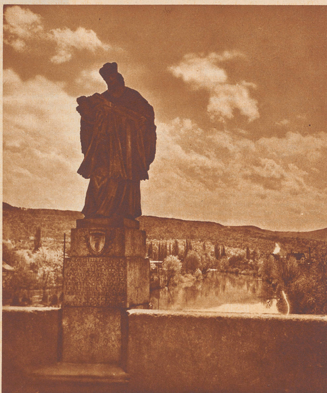
Ob dieser mildtätige Brückenheilige, der seinen Mantel beschützend über das Kind in seinen Armen hält, wohl weiß, wach zaubervolle Landschaft sich hinter seinem Rücken weitet? Unsere 13. Spezialtour führt bei Dornach über diese 1823 erbaute Birsbrücke.