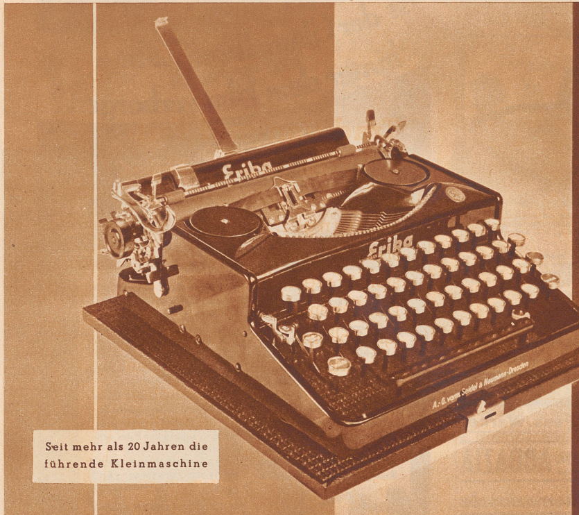
Seit mehr als 20 Jahren die führende Kleinmaschine