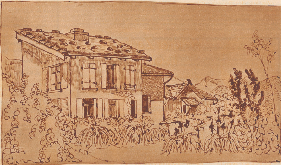
Casa di Lotti

An einem stillen Waldrand auf dem Albis war ich einsamer Wanderer mit diesen Worten aus meinem Versunkensein in den prächtigen Blick in das Reppischtal und Alpenkette geweckt worden. Die übermütigen Damen weideten sich an meinem Erstaunen, denn ich konnte mich tatsächlich nicht erinnern... Kollega? Der Wanderatlas in der Hand der einen belehrte mich über die Art der «Kollegialität» einerseits und mein Bundesabzeichen anderseits. Gewiß, Fußwandern, Freude am Genuß der heimatlichen Landschaft und Natur, das Verbundensein dieser gleichgesinnten Forschungsreisenden der Heimat durch die «Wanderatlasen», durch den «Wanderbund» schafft eine Art Kollegialität der Wanderer. Aber wie viele davon gehen einsam aneinander vorbei, die gerne miteinander gehen würden, einander wenigstens Aufschluß über Weg und Steg geben oder gar all das Erschaute in verstärktem Maße gemeinsam genießen würden. Wir werden