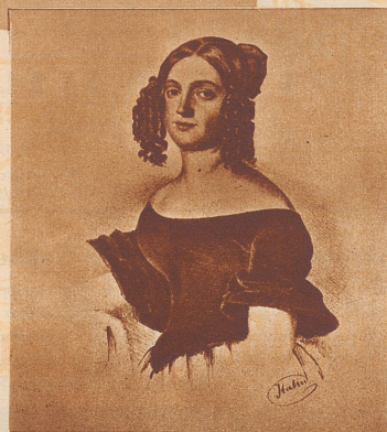
Charlotte Birch-Pfeiffer Leiterin des Zürcher Stadttheaters von 1837–1843.

In erster Linie stellen wir fest, daß die Schreiberin einer früheren Generation angehörte, in der es noch zu guten Ton gehörte, möglichst viele Gefühle zu zeigen. Die Sentimen-